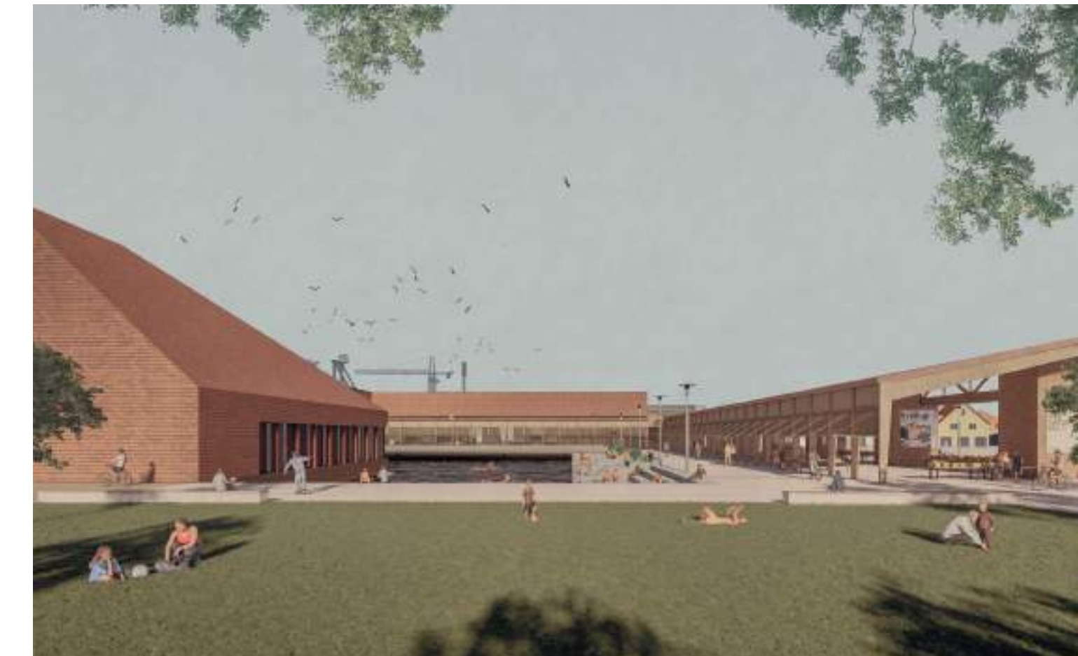
intériorité projetée : de la plage urbaine intime à l'immensité du port