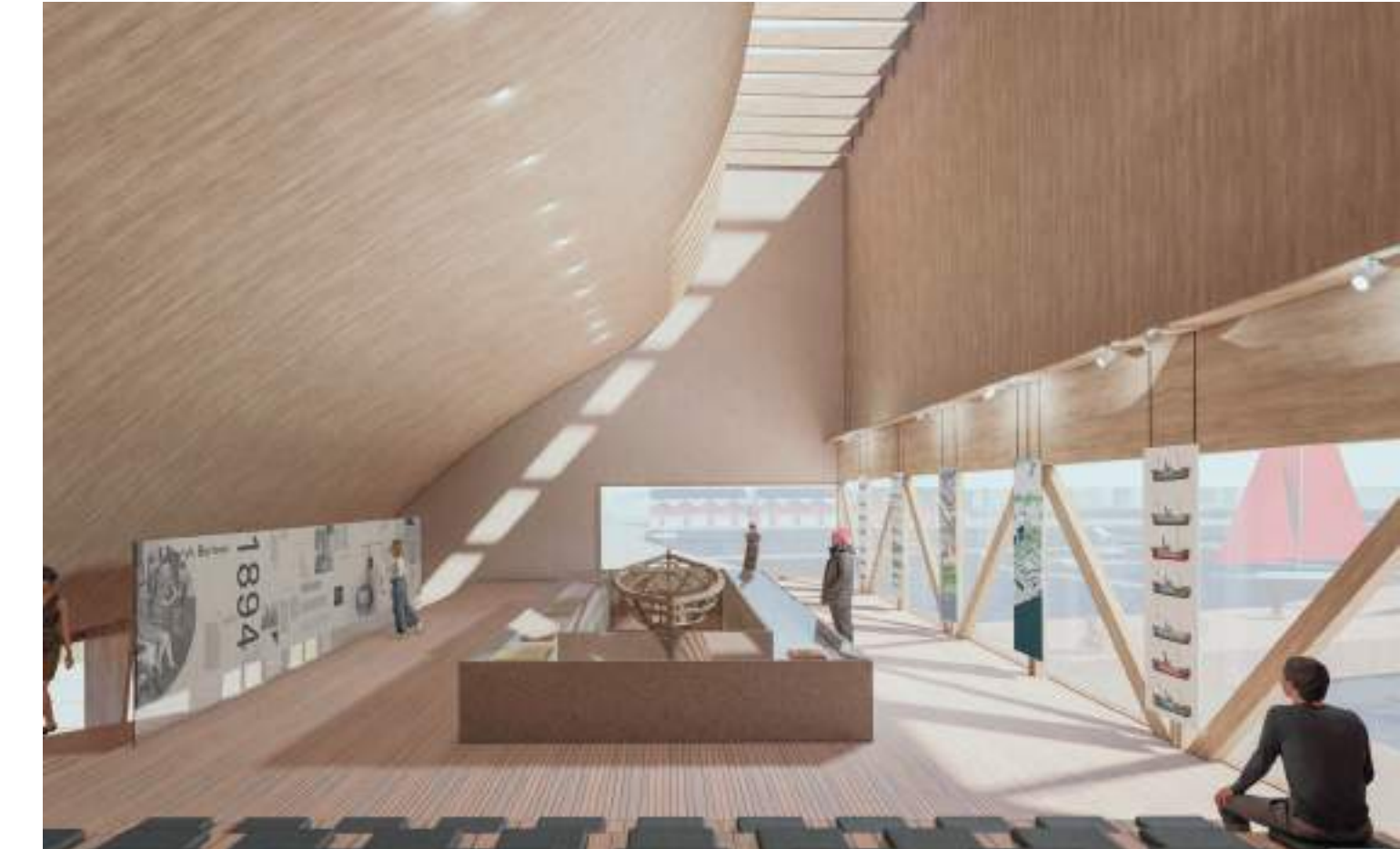
musée du port et de la pêche : faire découvrir un monde méconnu