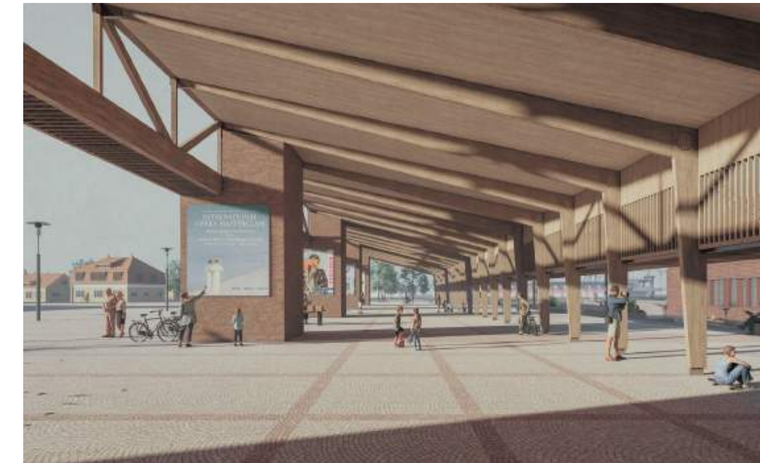
halle polyvalente : sol capable, sous-face fédératrice