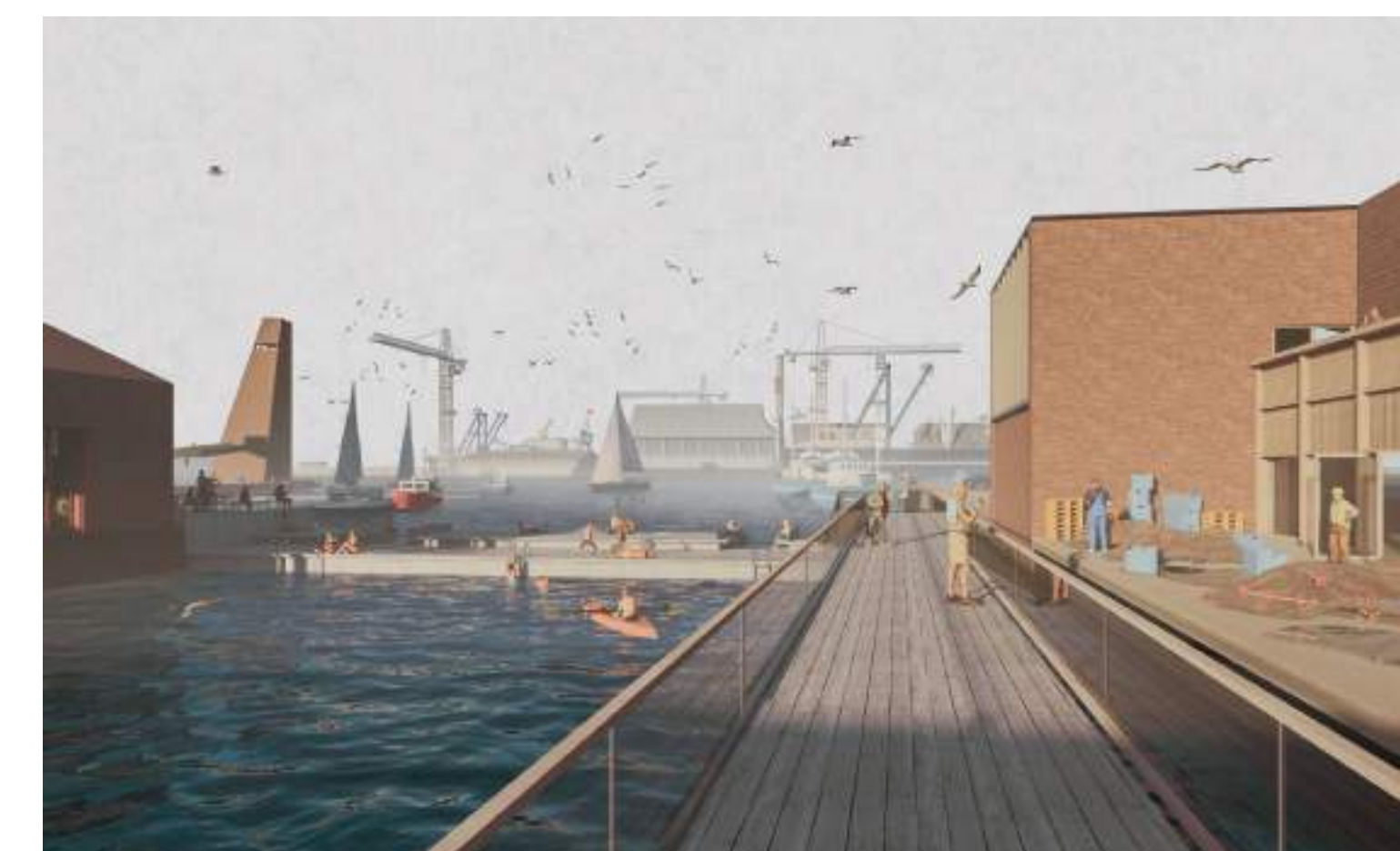
Lieu de cohabitation entre pêcheurs, habitants et touristes