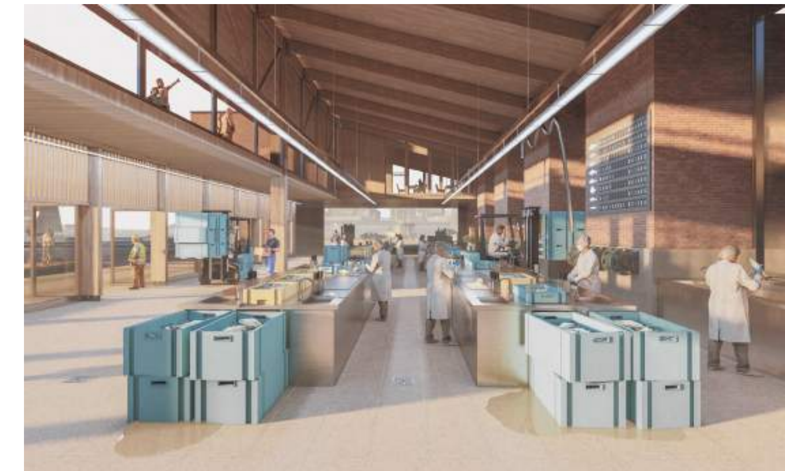
la nouvelle halle aux poissons et son restaurant : interface ville-port