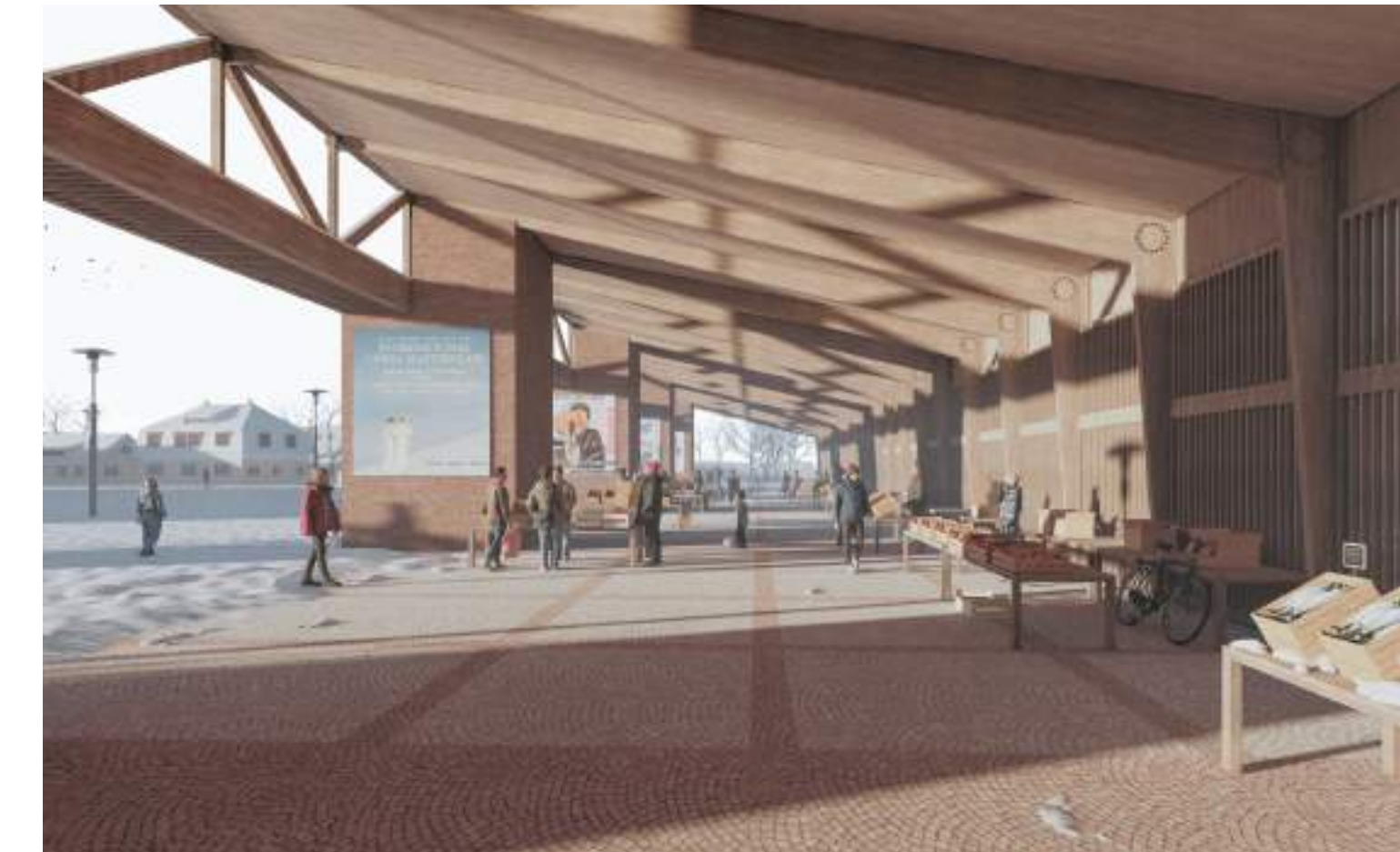
sous-face fédératrice et modulable : faire face à l'hiver danois