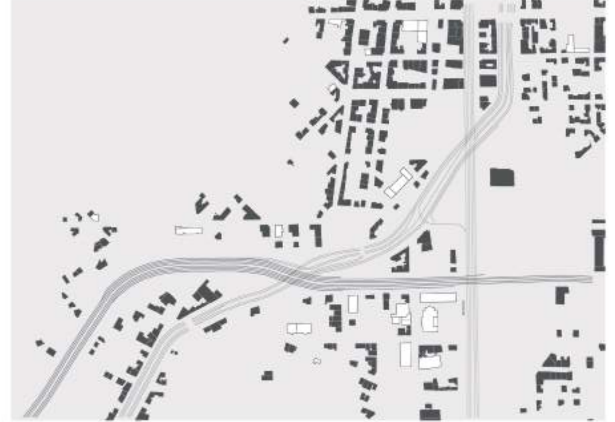
LES ROUTES SUPPORT D'ACTIVÉS