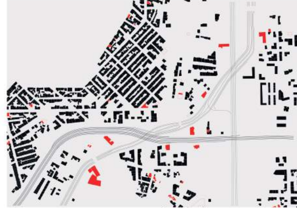
LES ROUTES VECTEUR DE DÉLAISSÉS