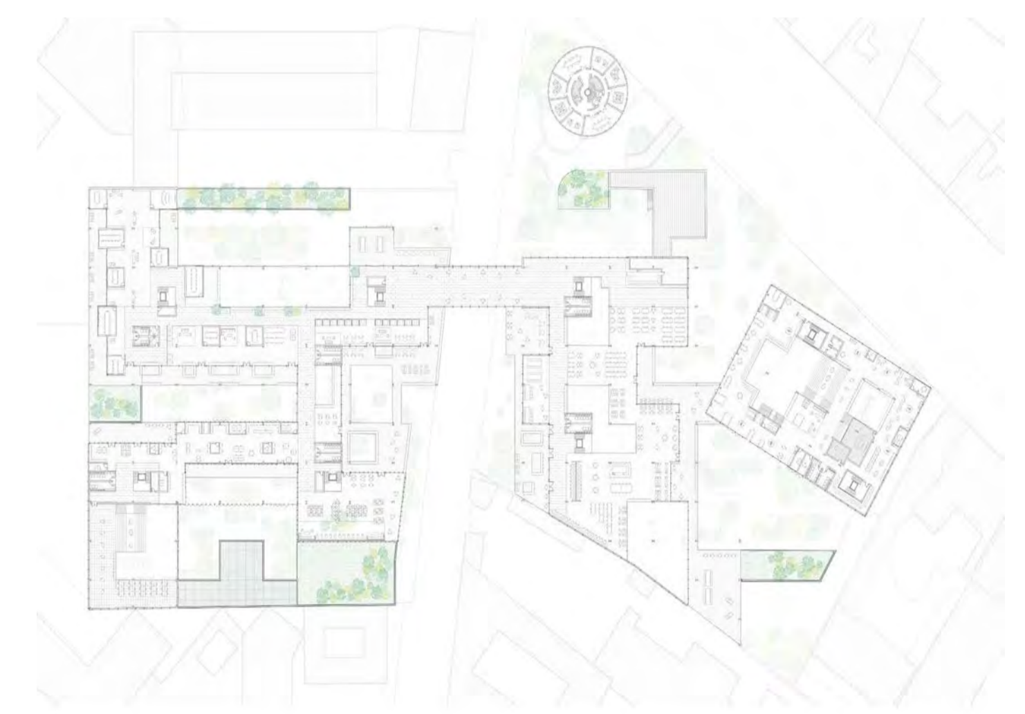
Plan du r+1