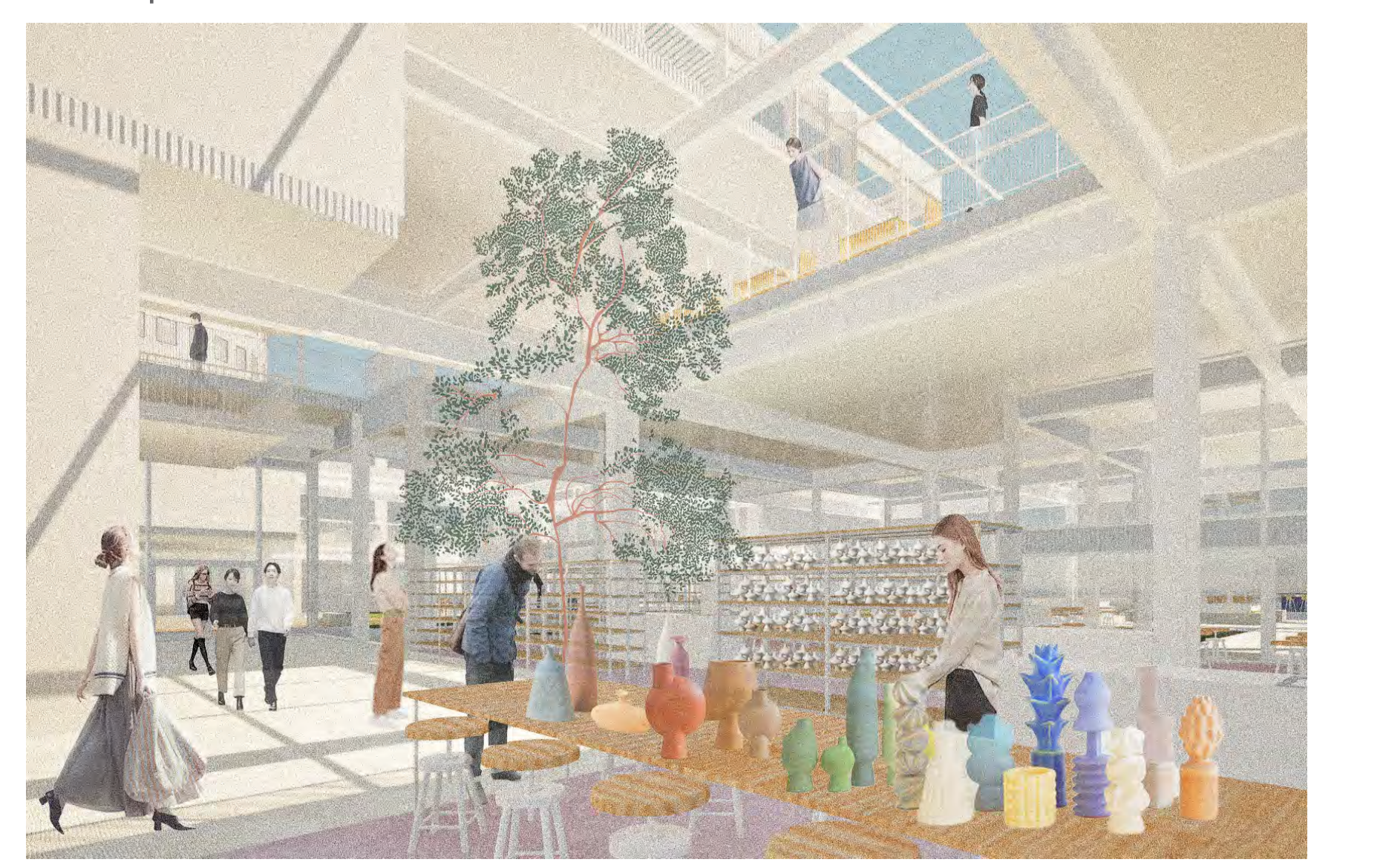
4 Espace de workshop