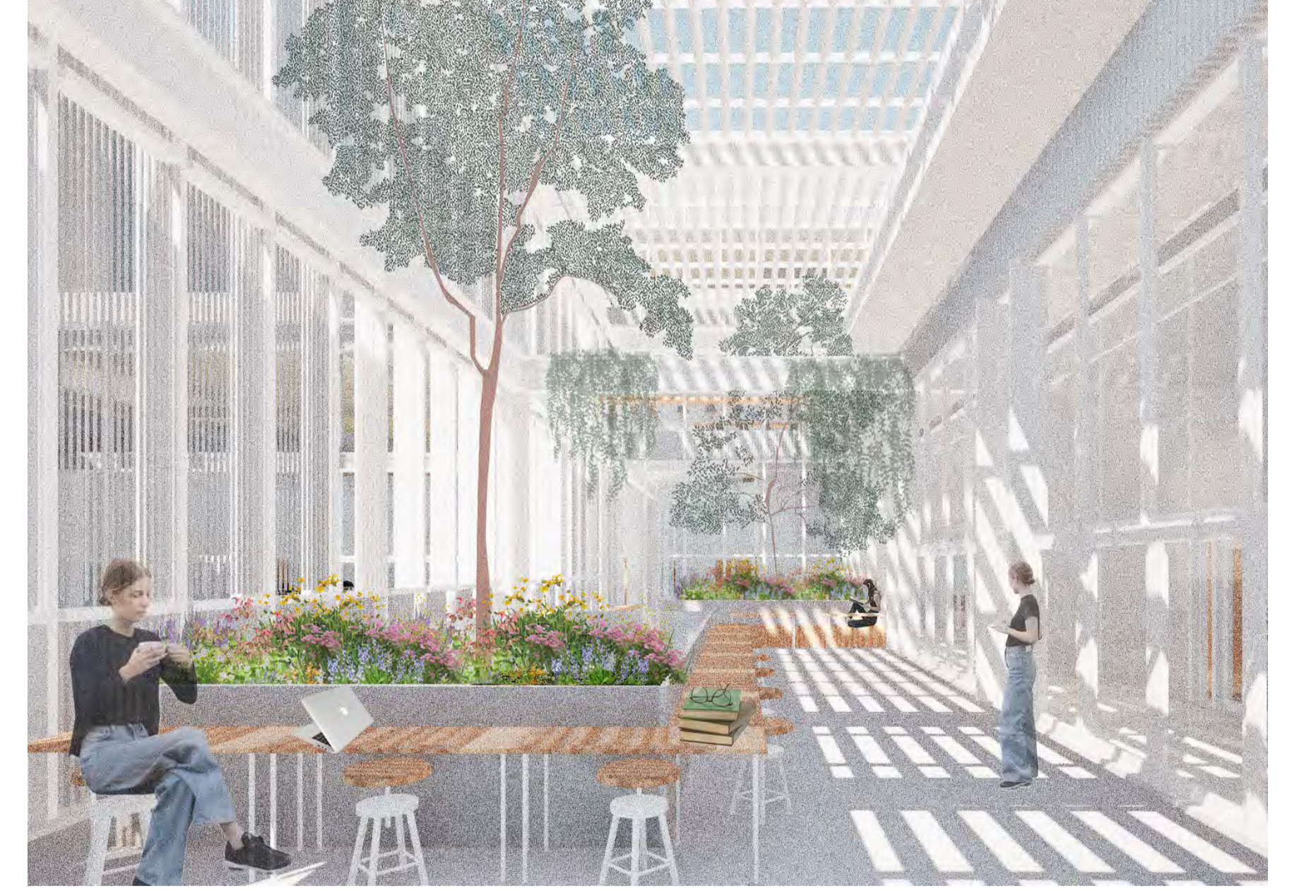
3 Espace de travail semi-extérieur