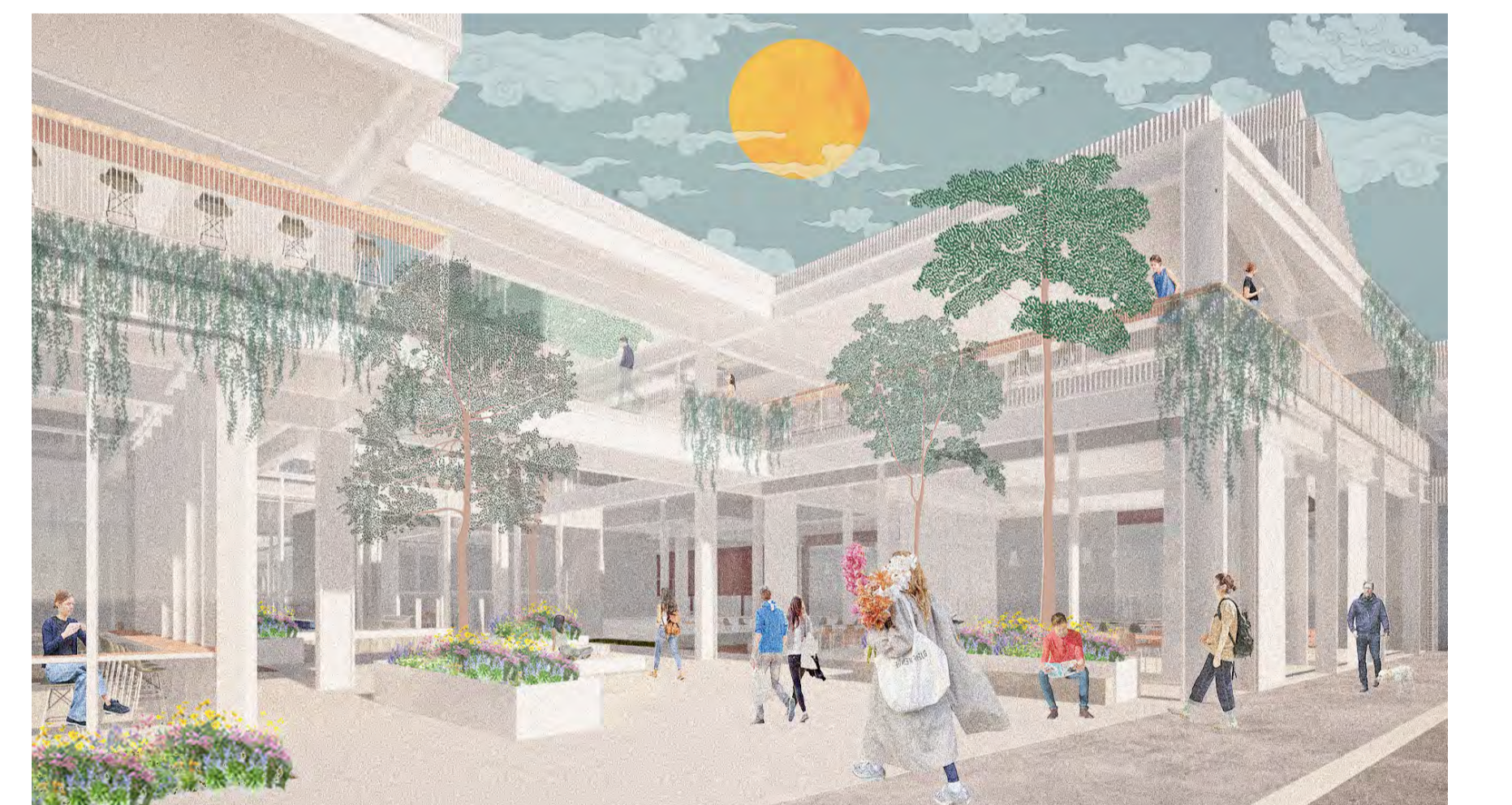
2 Entrée principale