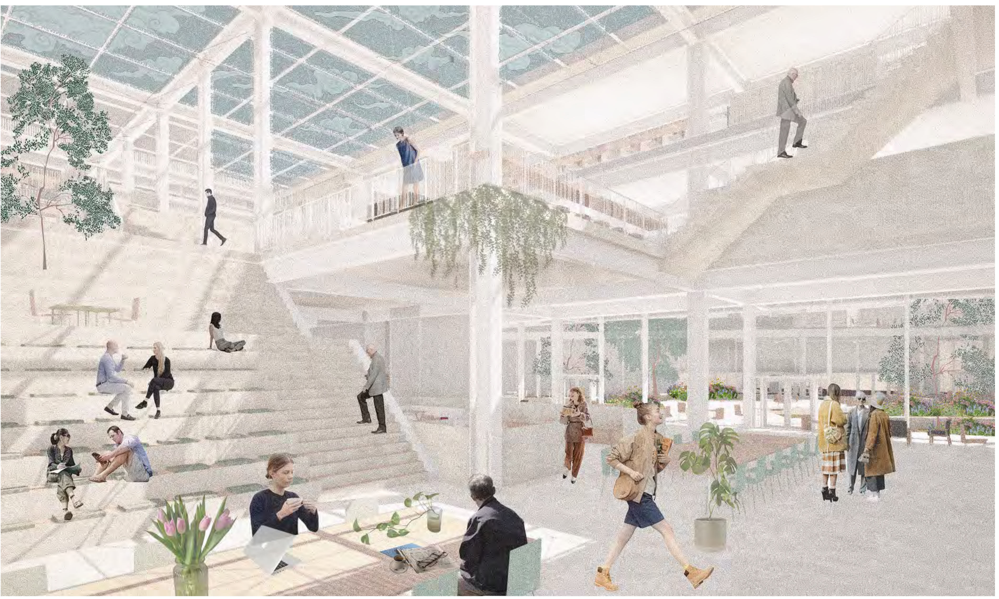
5 Espace de co-working