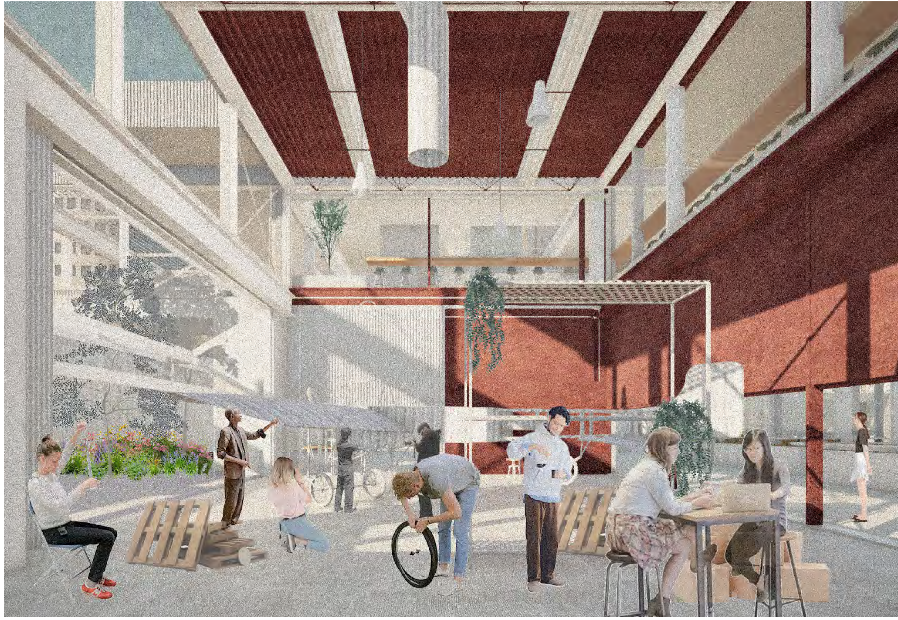
1 Espace d'assemblage