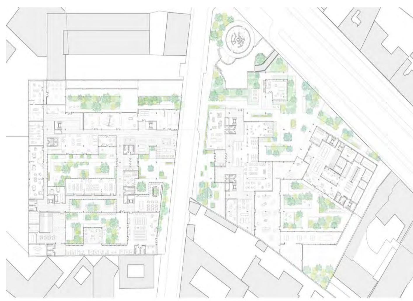
Plan du rez-de chaussée