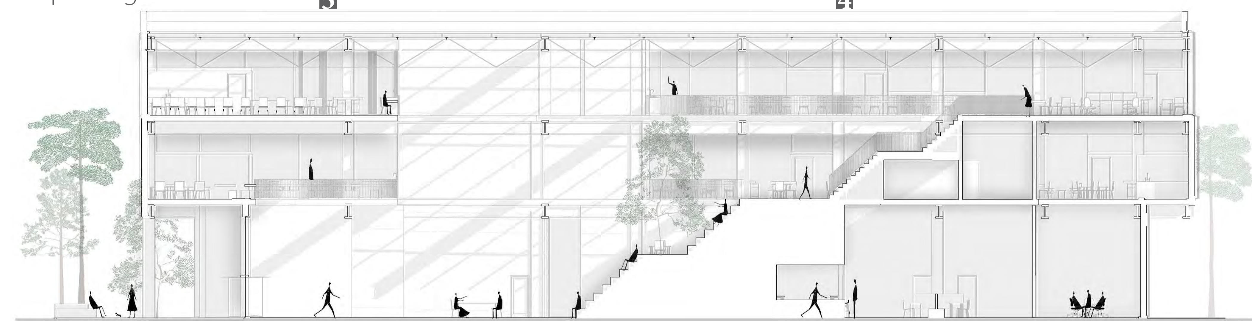
Coupe longitudinale - espace de co-working