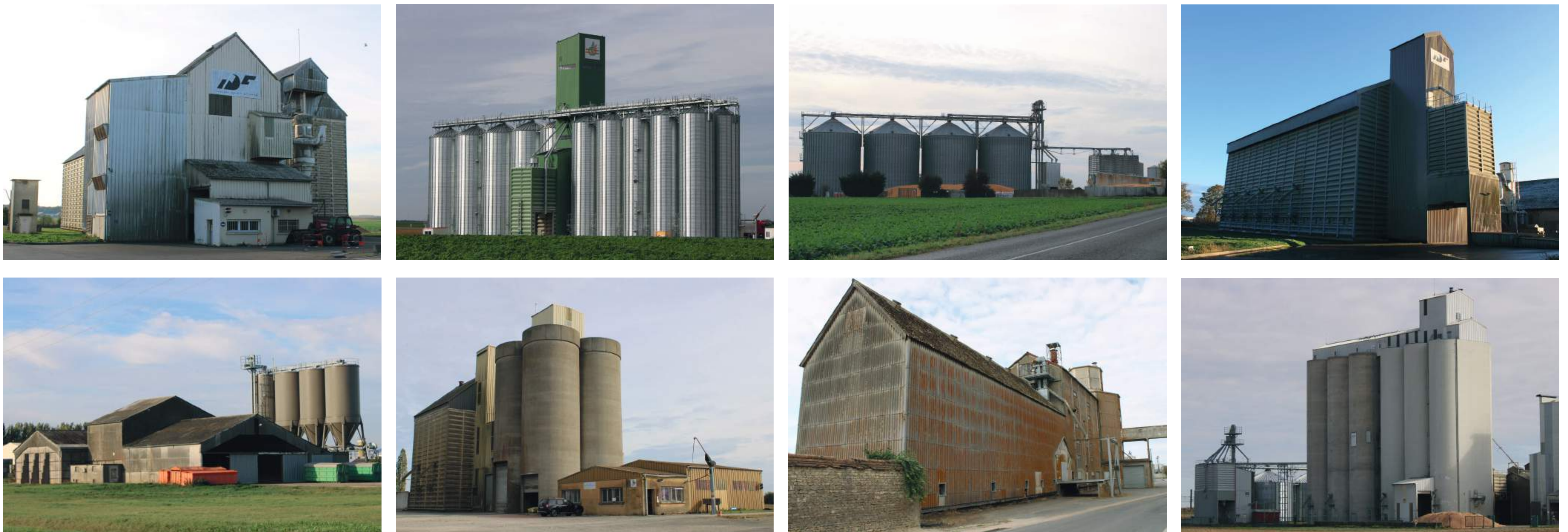
LES SILOS EN BEUCE