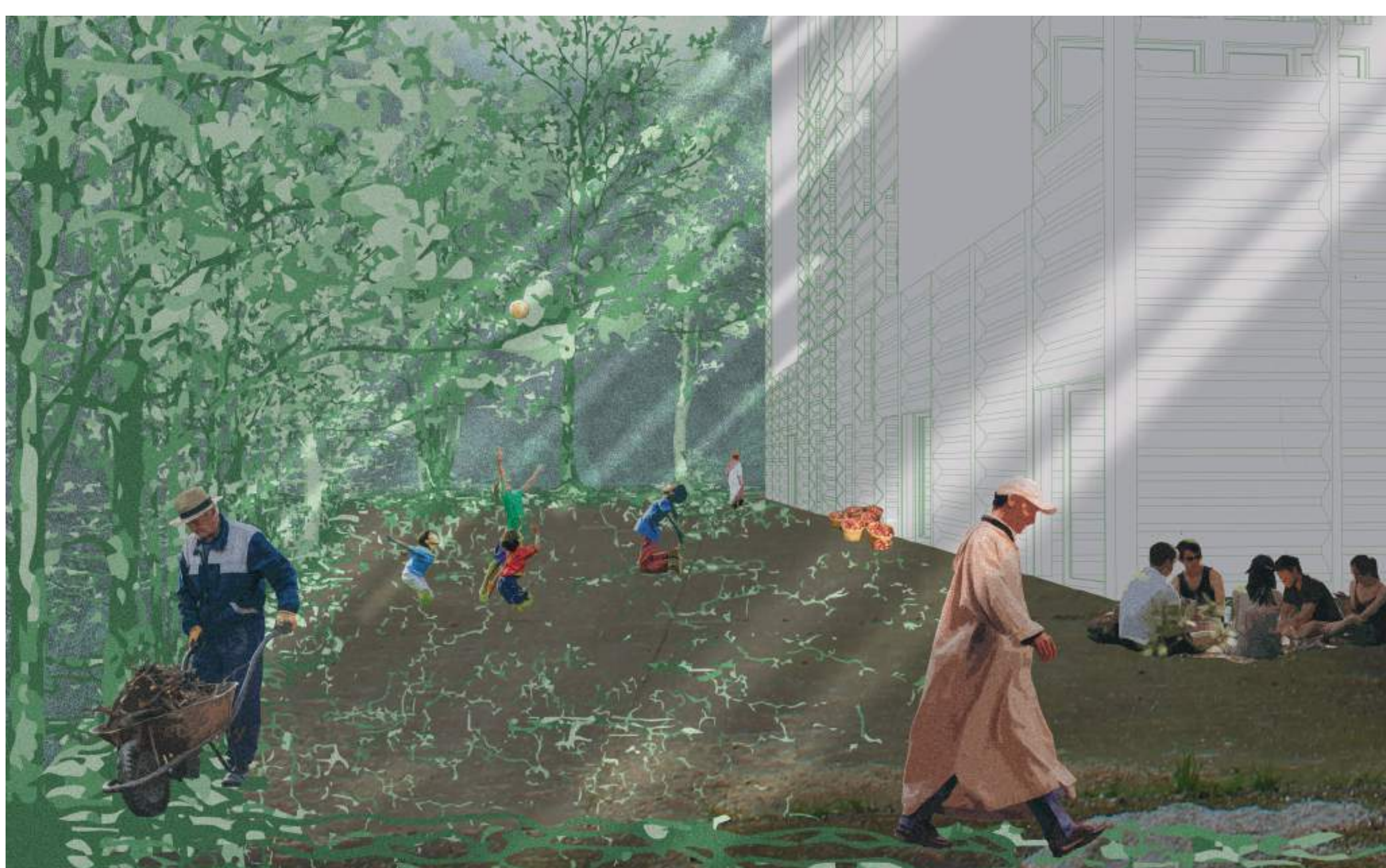
LA VIE A L'OMBRE