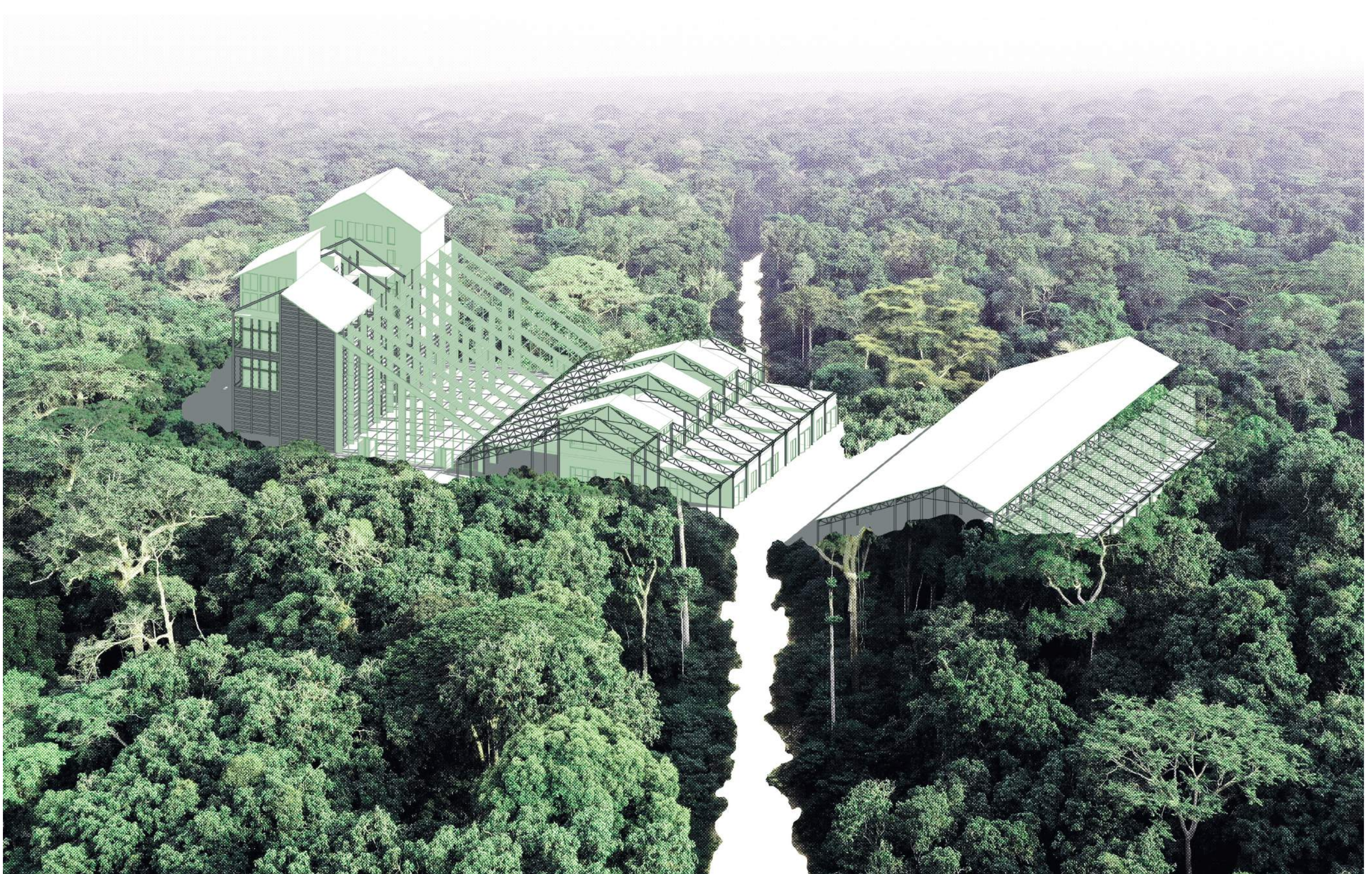
LE SILO DANS 50 ANS : UNE OASIS