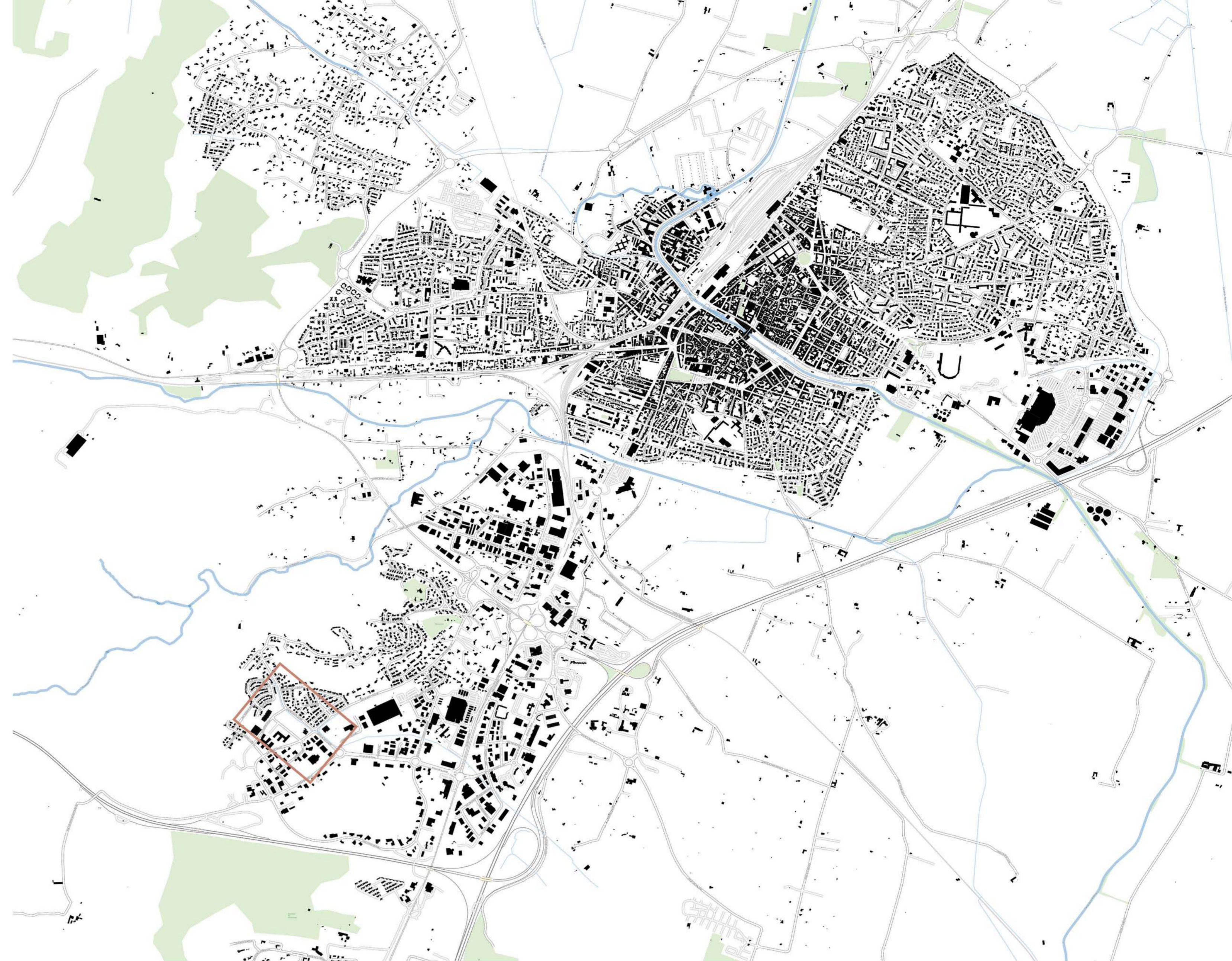
L'étalement urbain dû à l'augmentation du nombre de personnes âgées auquel fait face la ville de Narbonne