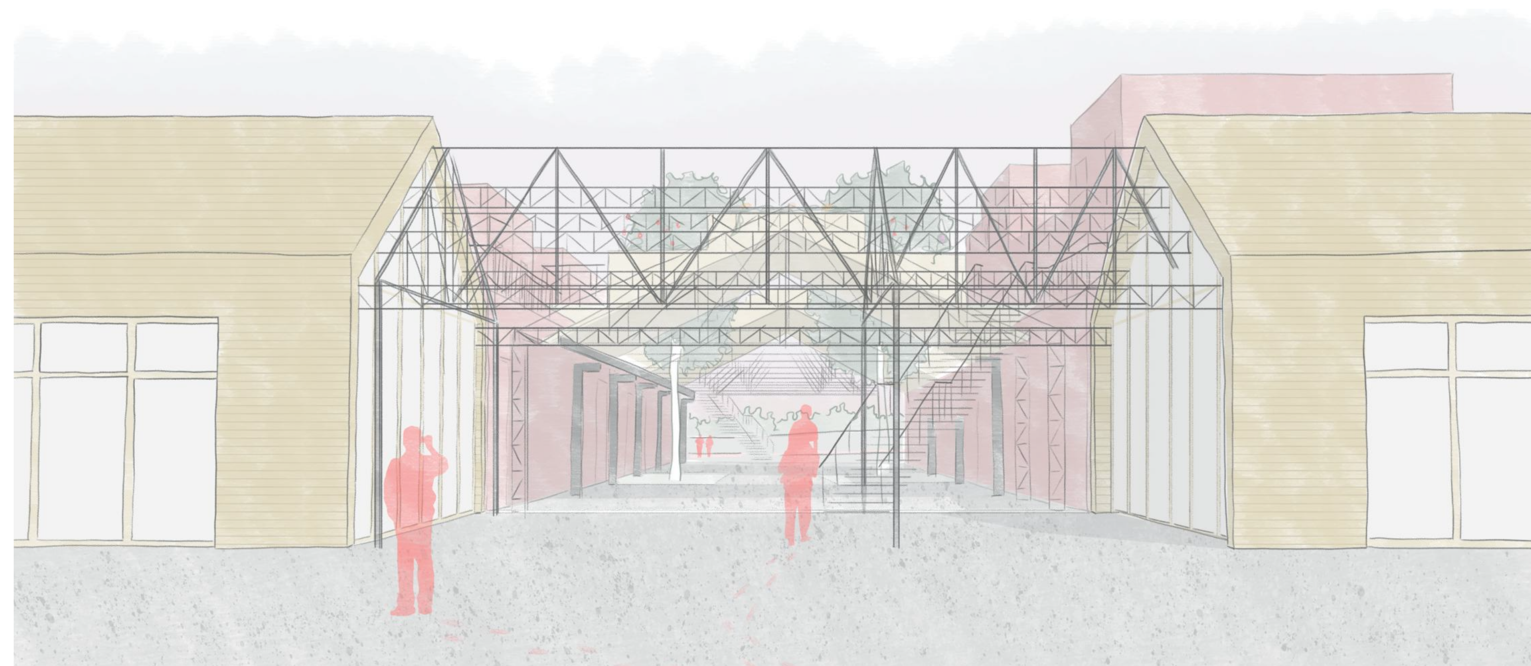
3 - Un îlot d'activité et de logement Du cœur de quartier au parc paysagé