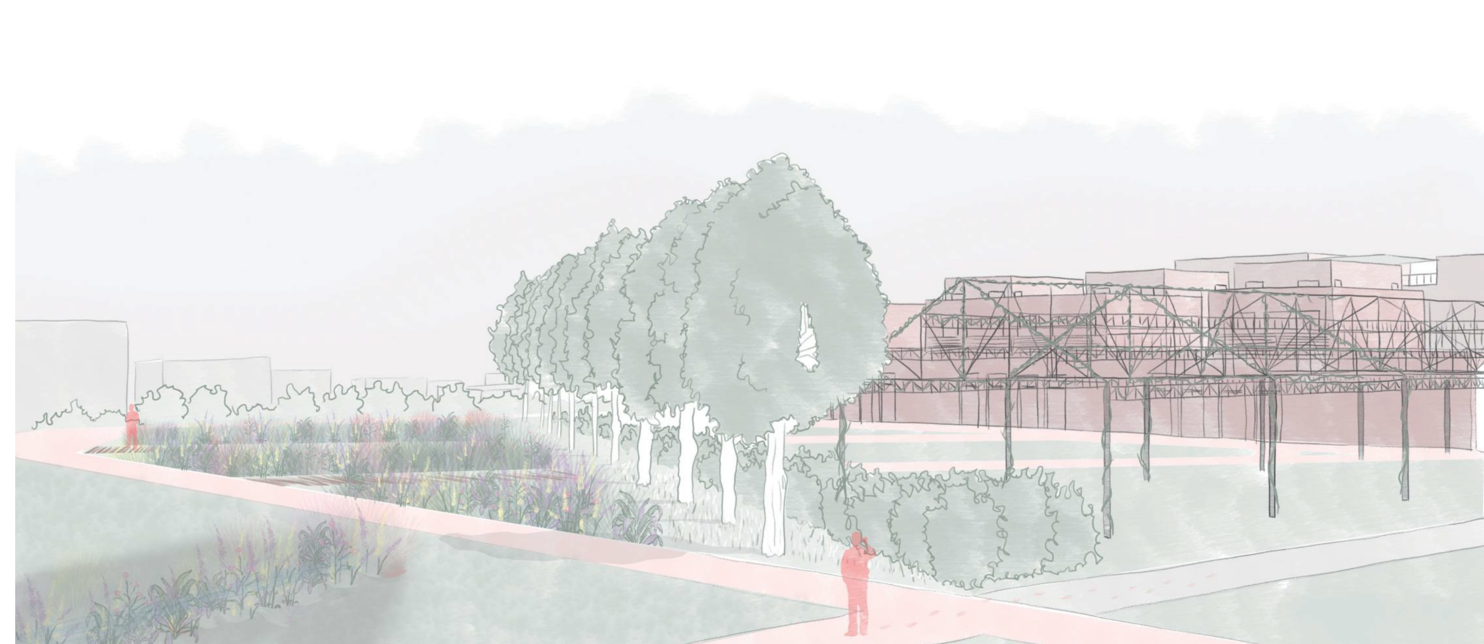
4 - Le parc