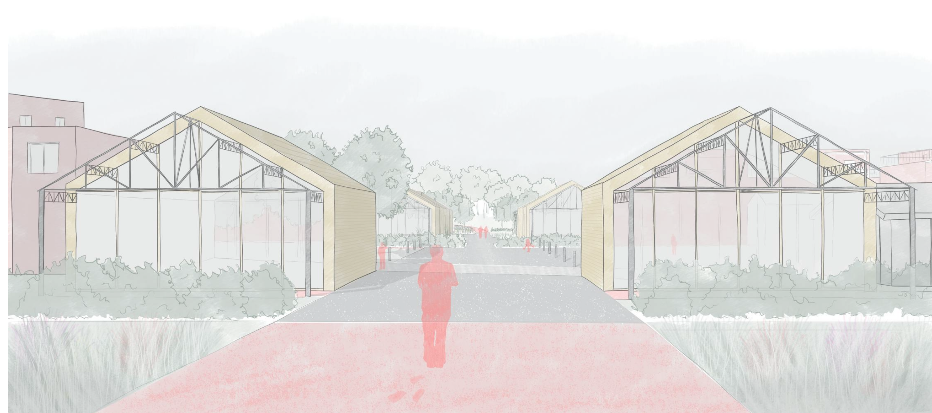
1 - Entrée sur le site