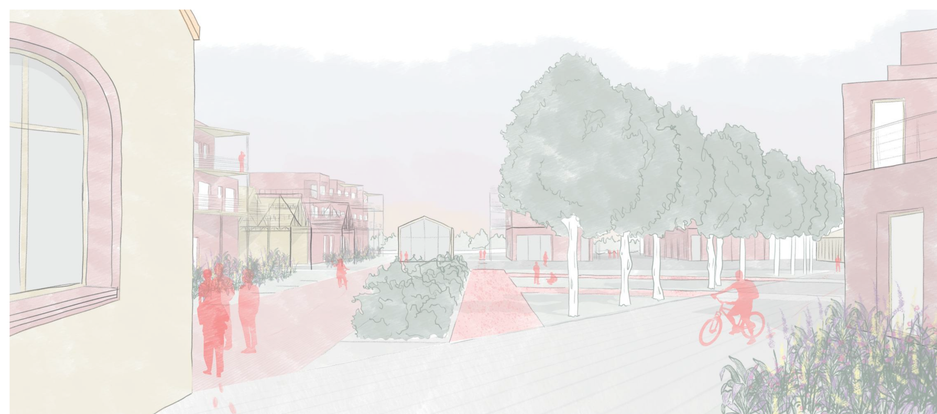
2 - La place de rencontre