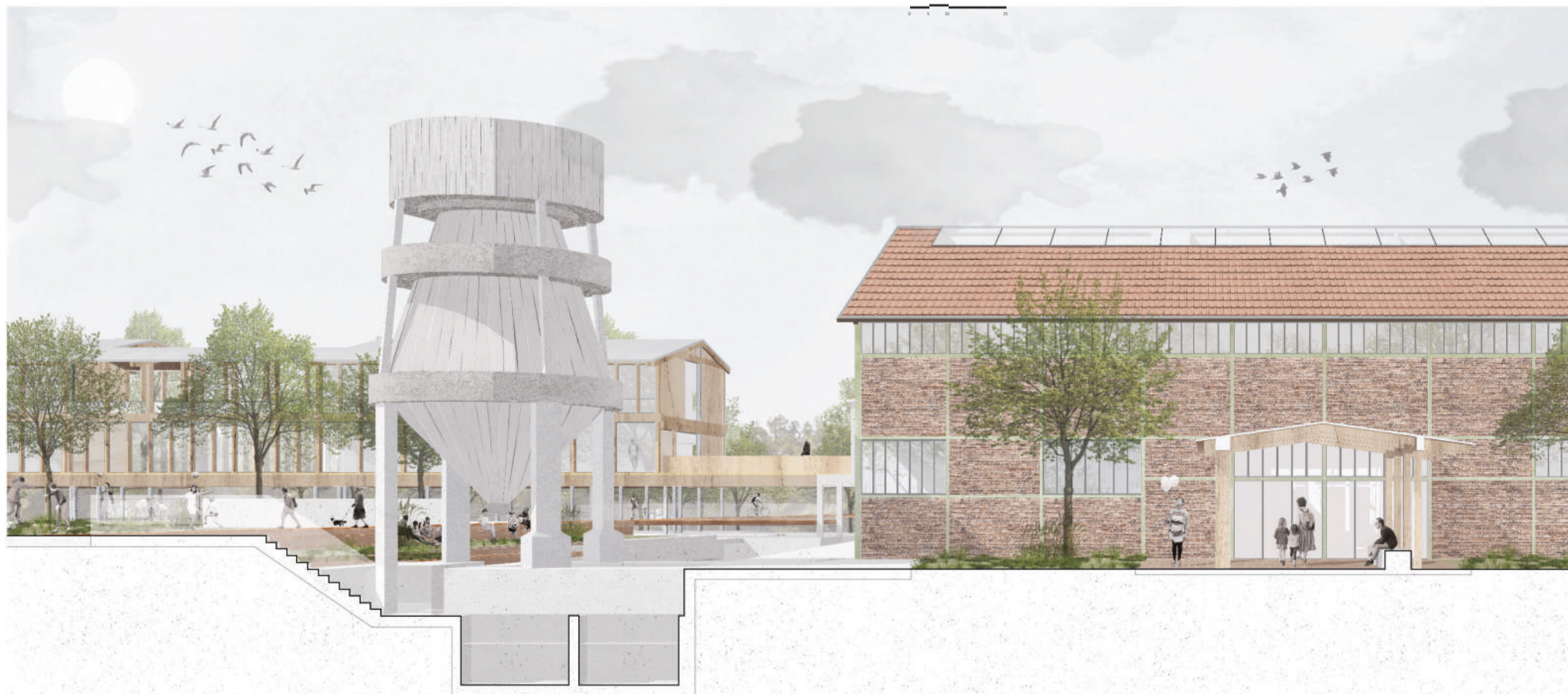
↓ DIALOGUE ENTRE MATÉRIALITÉS EXISTANTES ET CRÉES (POINT DE VUE ①)