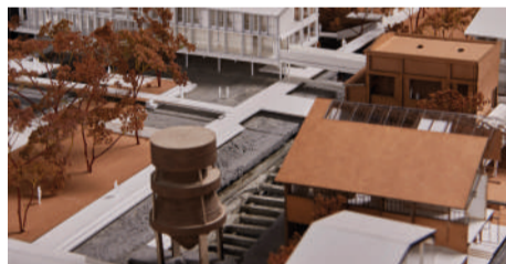
↑ PHOTOGRAPHIES DE LA MAQUETTE 1:200 DU PROJET