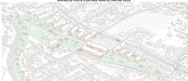
Axonométrie - Etat projeté