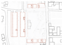
Plan du pôle multimodal