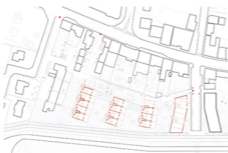
Plan de l'îlot nord