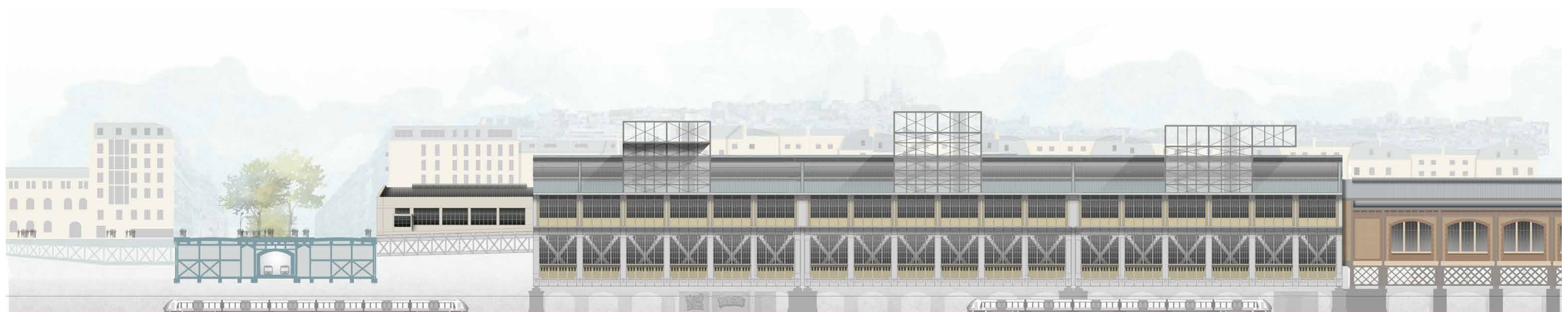
Rapport au paysage ferroviaire accentué grâce aux belvédères