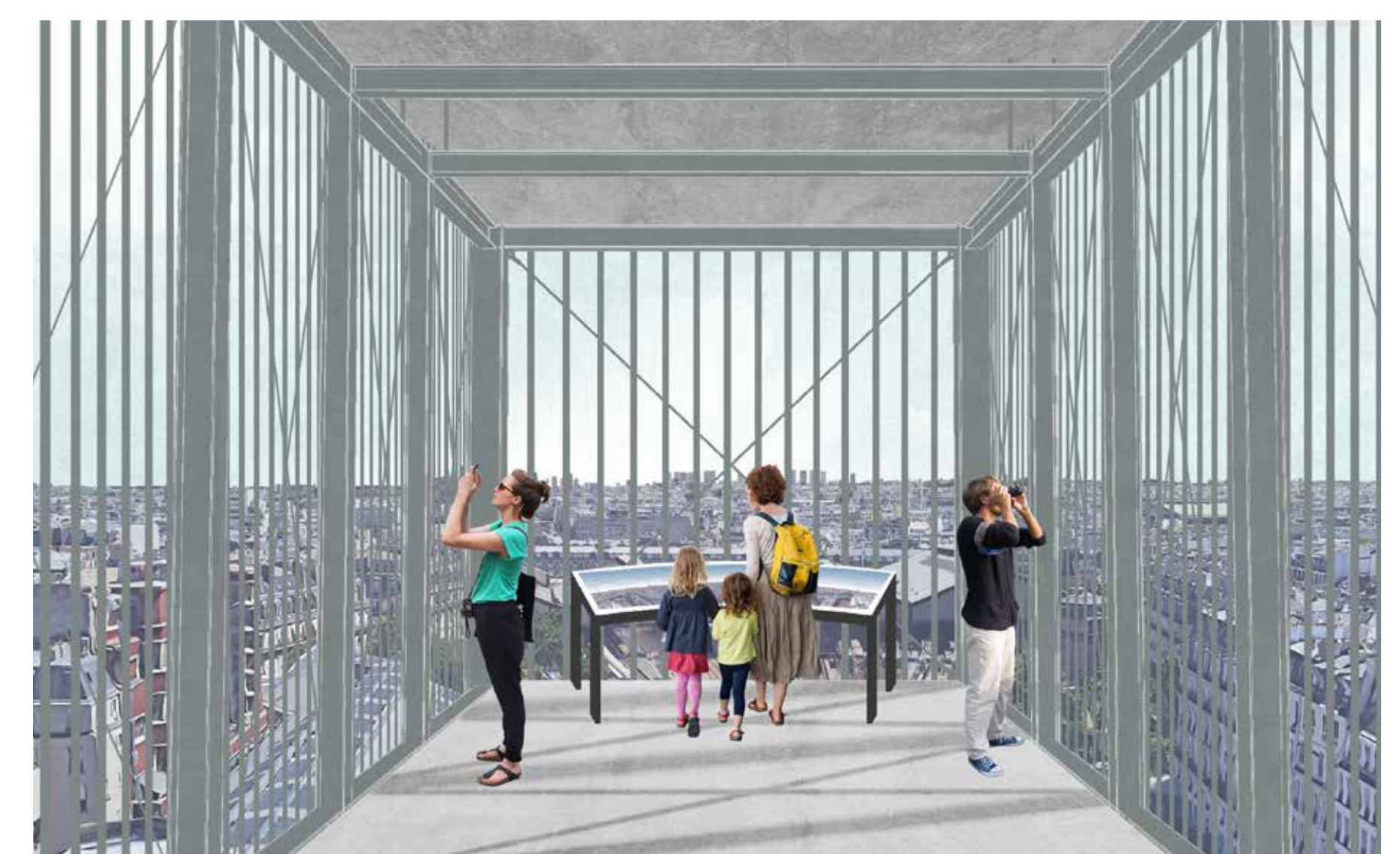
Vue de puis le belvédère sud