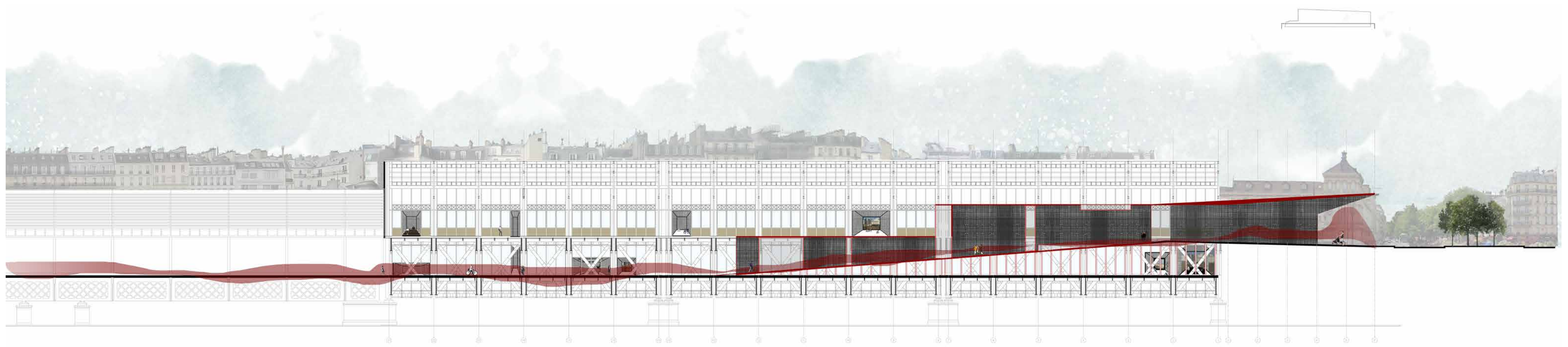
Le passage Batignolles-Europe - Un accès piéton ouvrant le bâtiment au public et témoignant de sa transformation