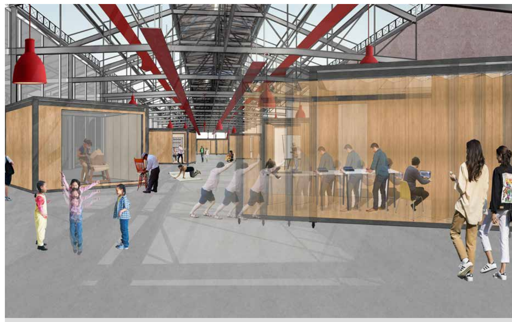
Les modules permettent de s'isoler tout en gardant un contact visuel