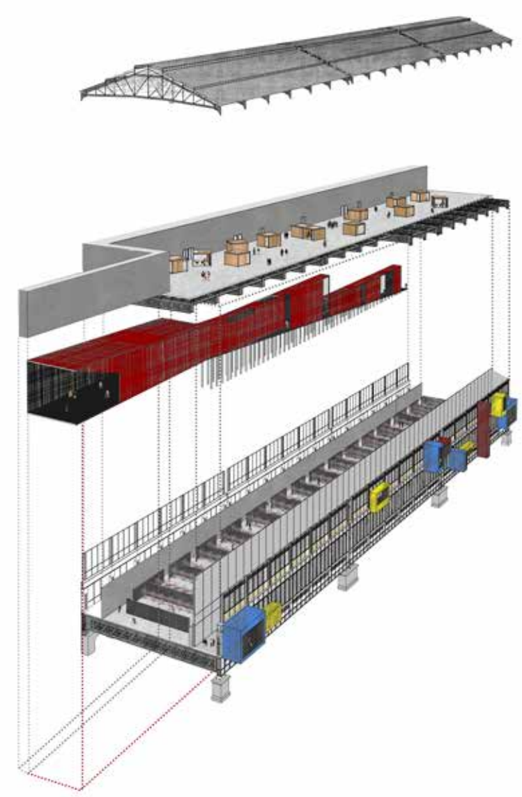
Un cadre fixe et une proposition mobile