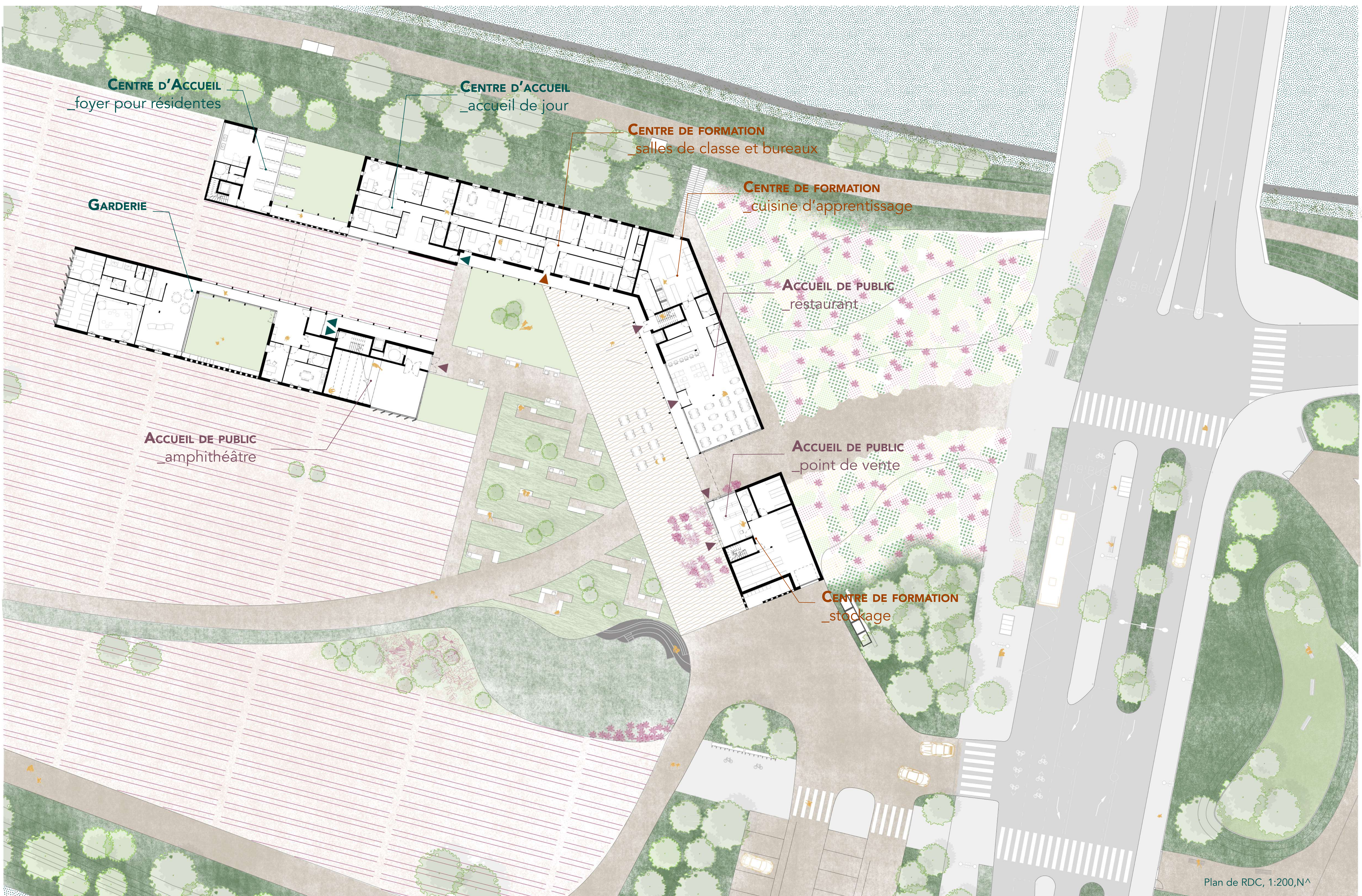
Plan de RDC, 1:200, N^