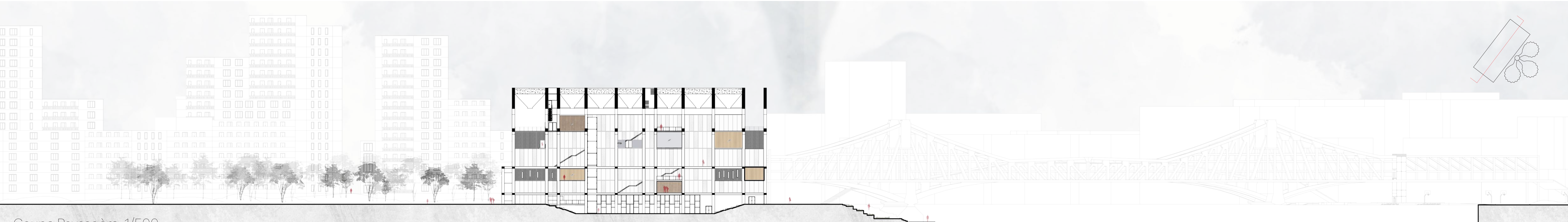
Coupe Paysagère 1/500