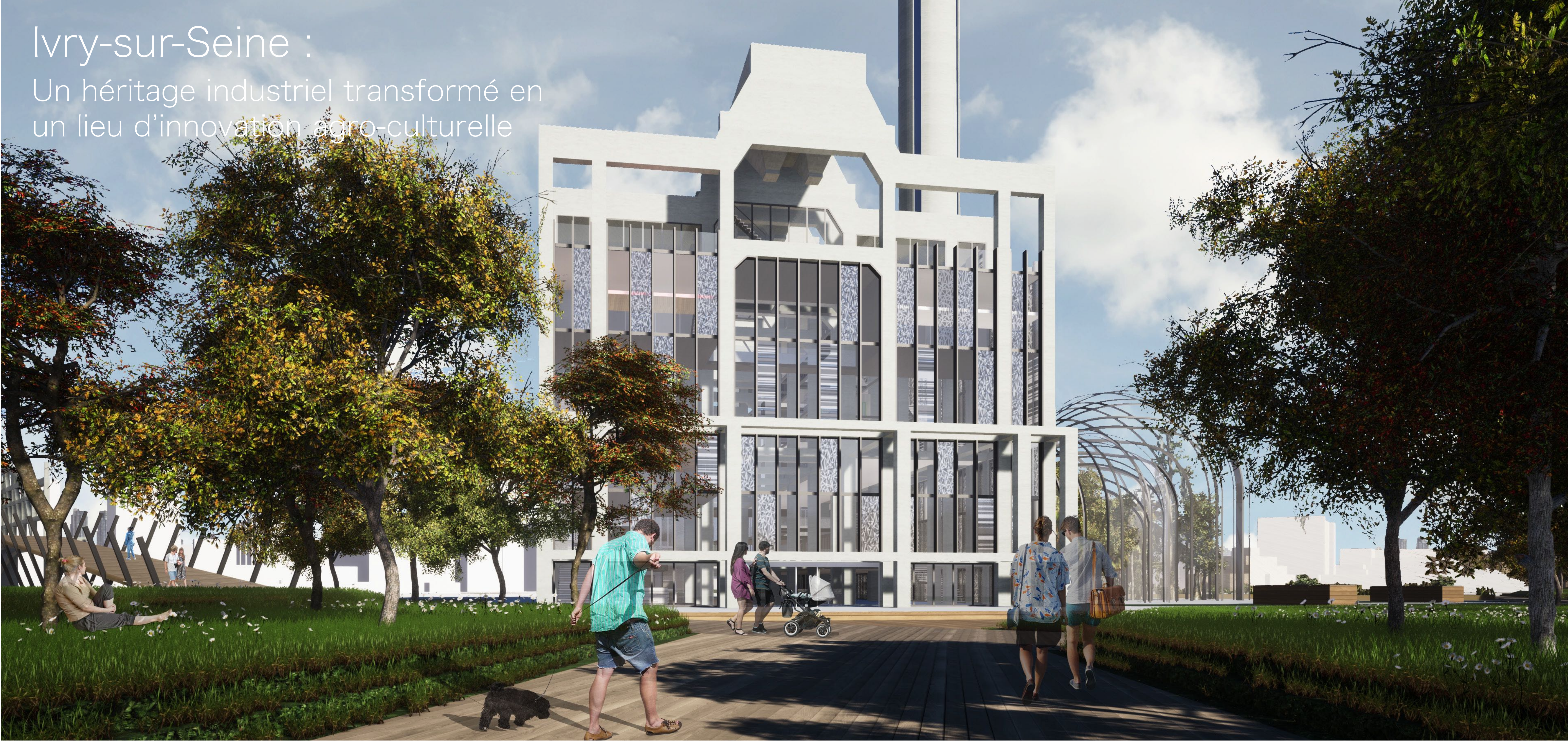
Perspective depuis le Parc des Confluences