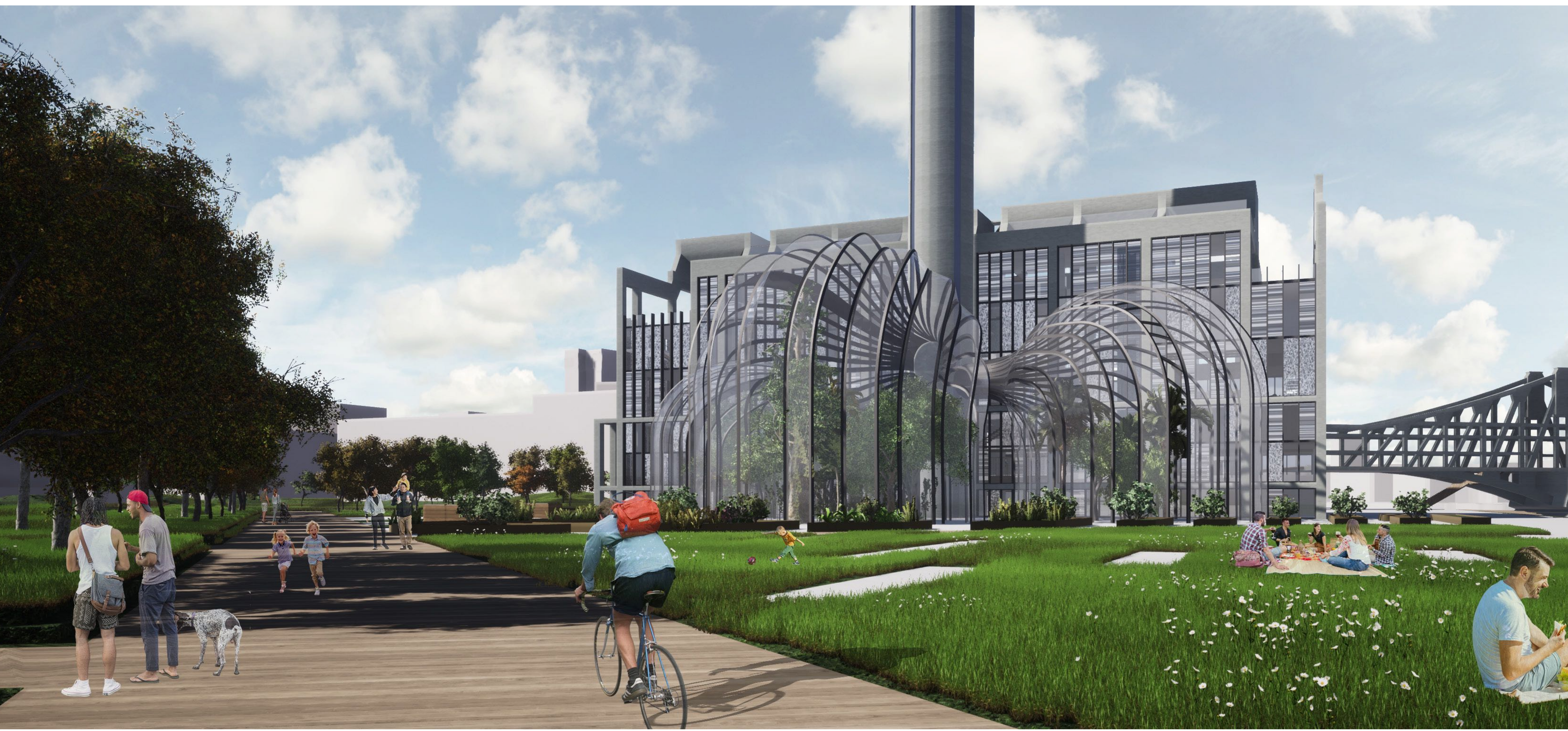
Perspective depuis les quais de Seine