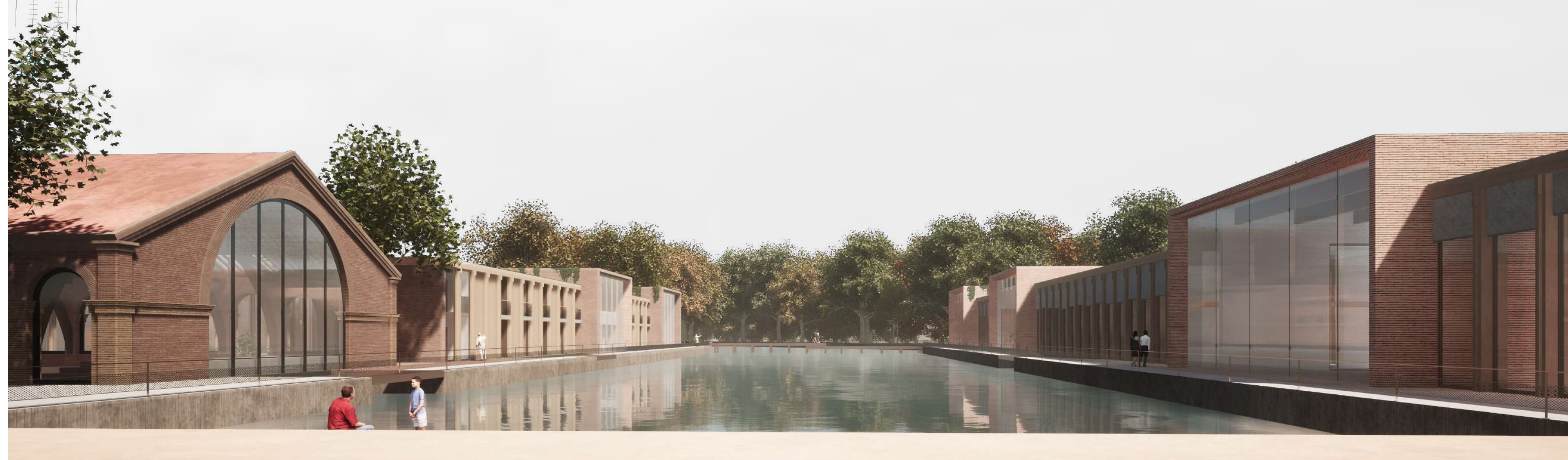
PERSPECTIVE FACE À FACE DES PROJETS - VUE SUR LE BASSIN Romain HINET - Anatole LANGE / M2-S10