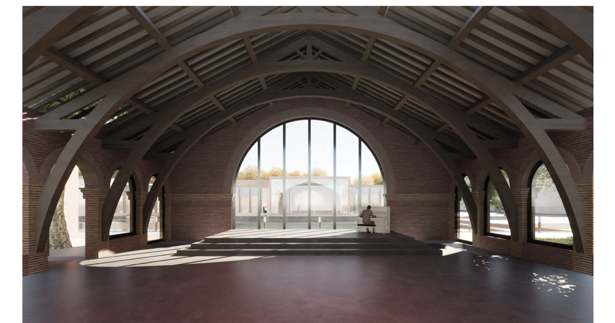
CALE COUVERTE - SALLE POLYVALENTE - SCÈNE - MAISON DE RETRAITE