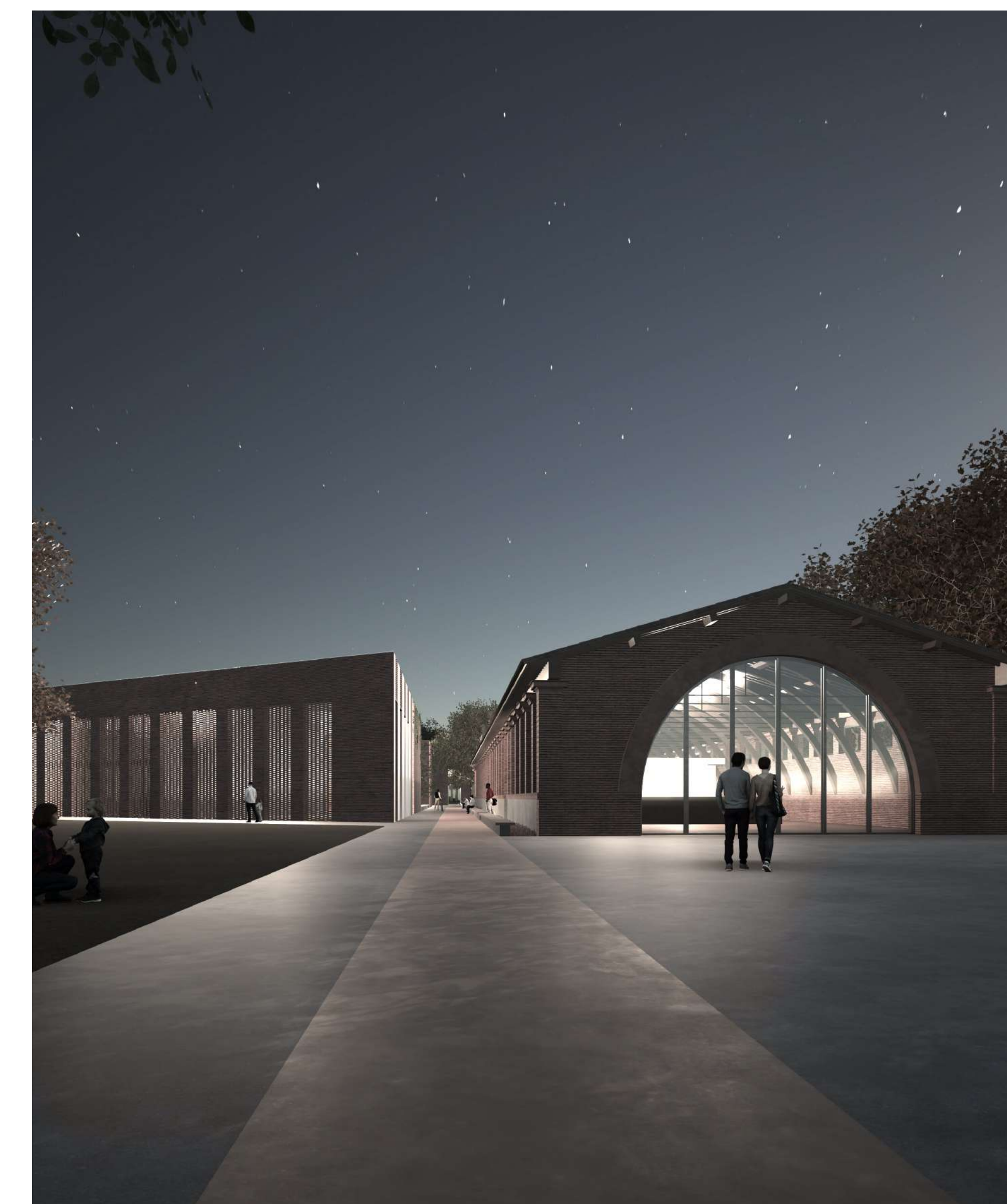
PERSPECTIVE DU PARS DU MUSÉE - ORIENTER LE REGARD