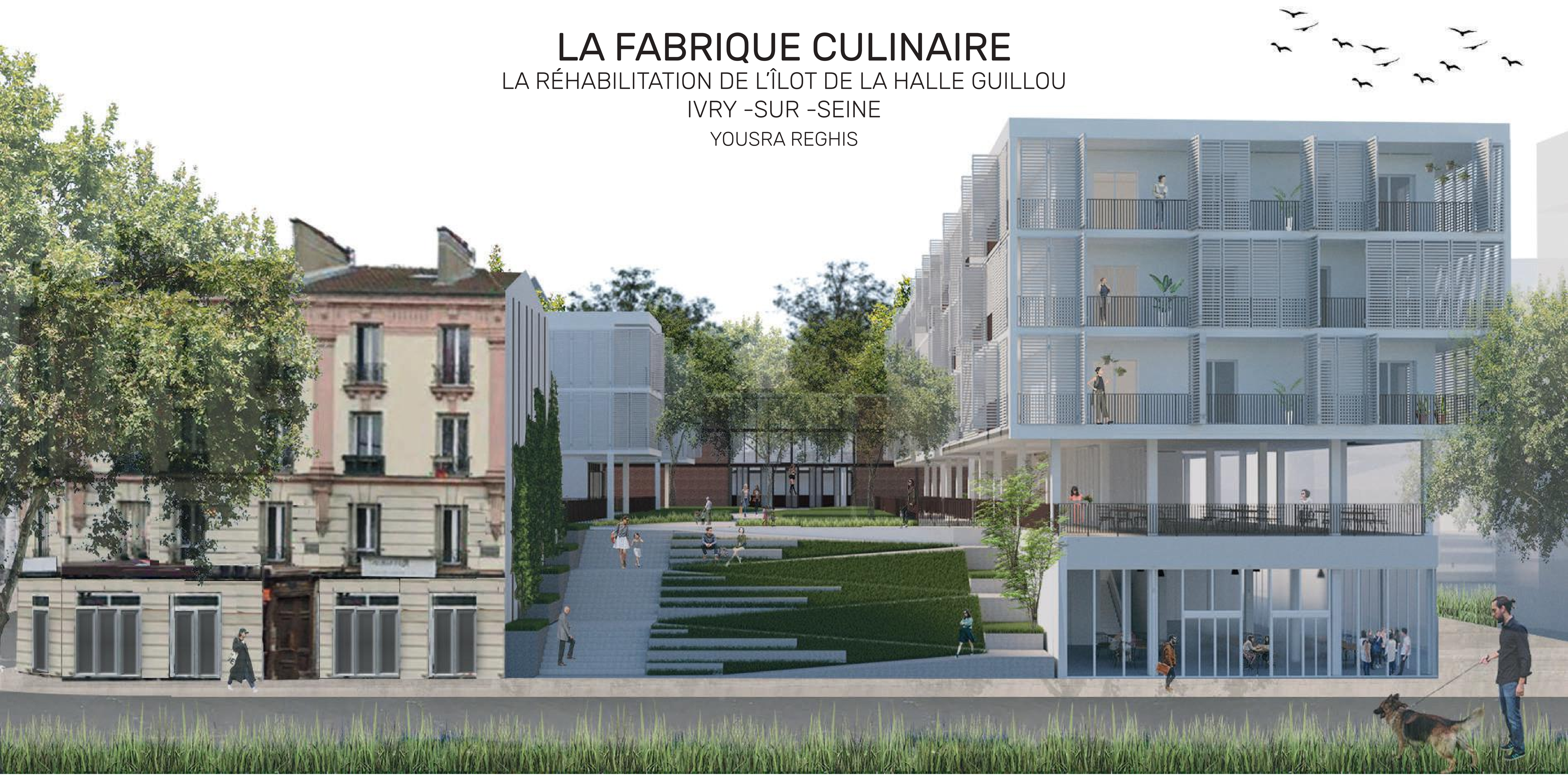
Perspective principale du boulevard Vaillant Couturier