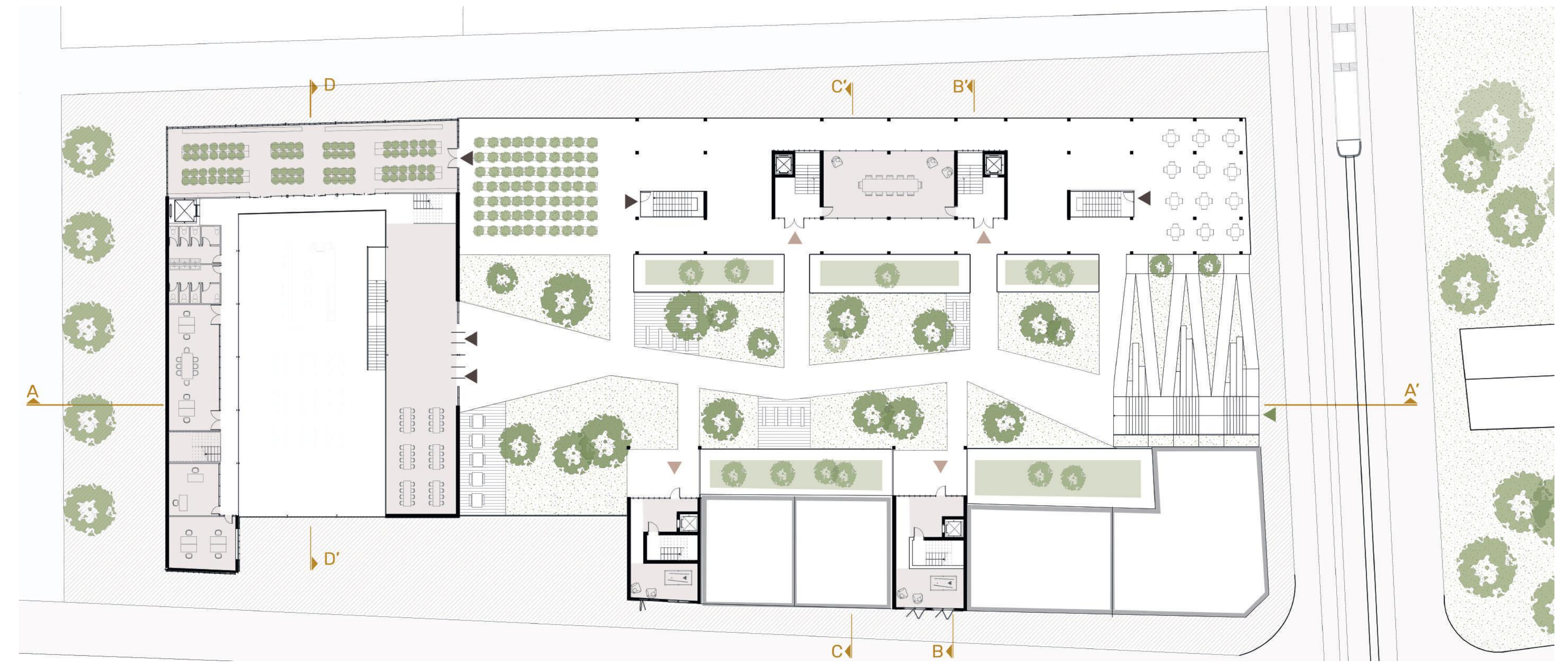
Plan R+1 -jardin-